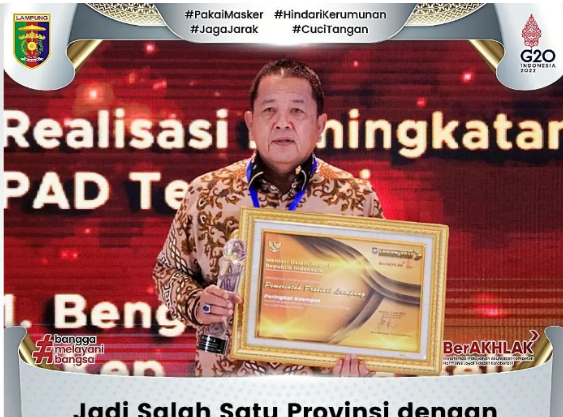
Jadi Salah Satu Provinsi dendaan Sumber Data BPKAD Provinsi Lampung, 2022