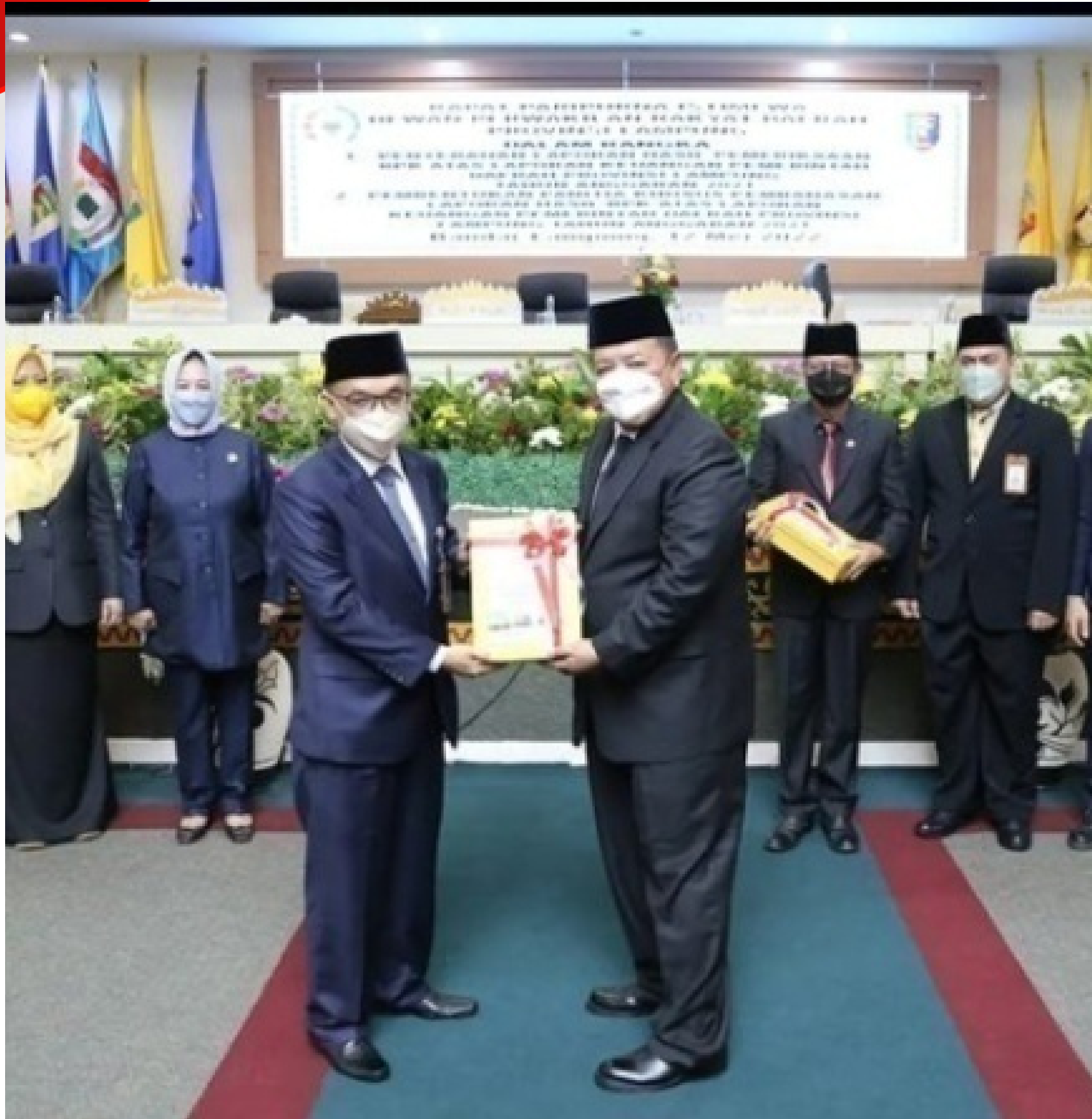
Sumber Data BPKAD Provinsi Lampung, 2022

i. Pernyataan Opini WTP dari BPK atas Laporan Keuangan Pemerintah Daerah adalah prestasi pemerintah Provinsi Lampung yang menjadi sasaran strategis BPKAD Provinsi Lampung dalam hal Penyajian Laporan Keuangan Tahun Anggaran 2021 yang diterima pada tanggal 22 Mei 2022 oleh Gubernur Lampung