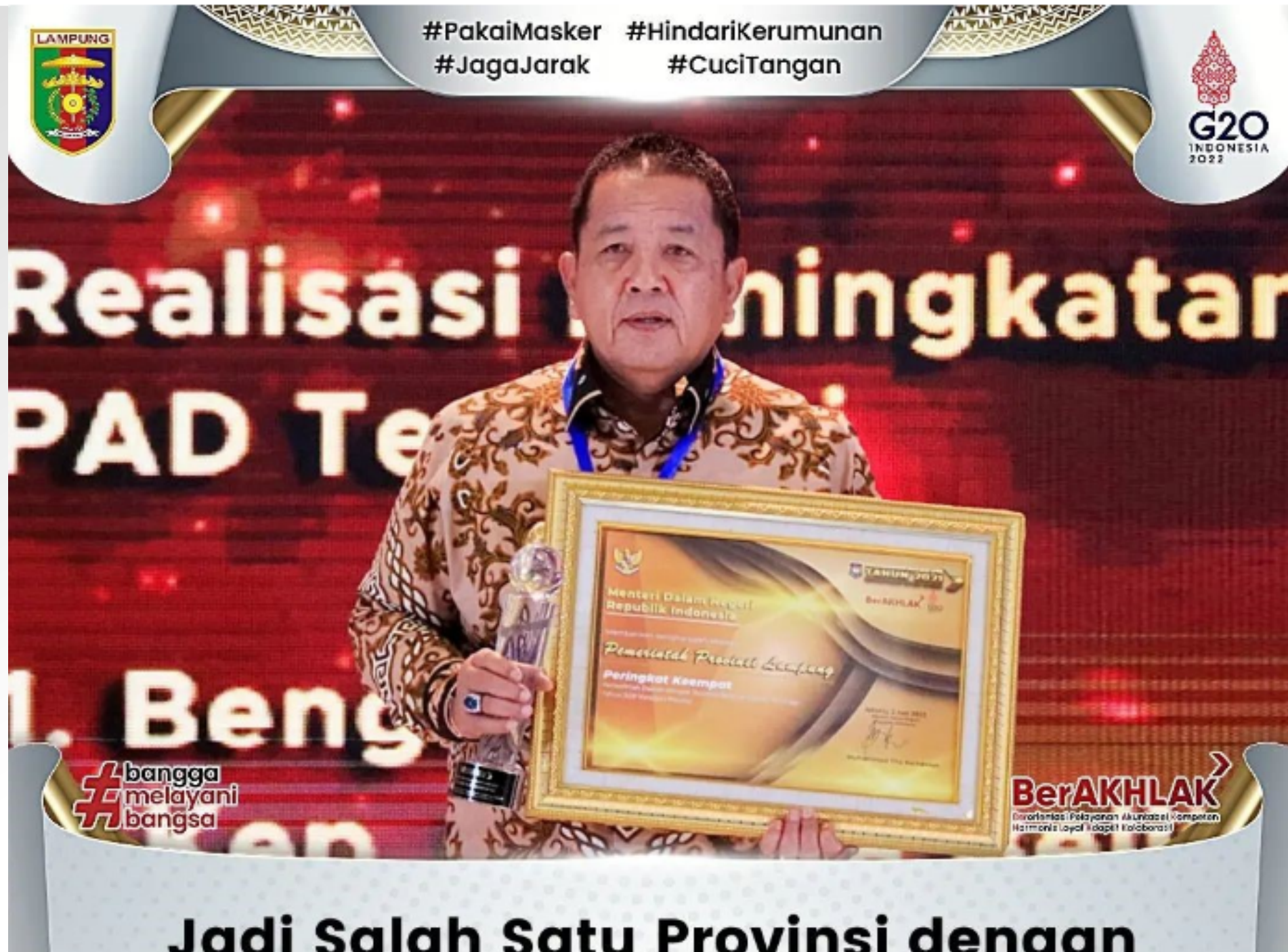
Jadi Salah Satu Provinsi dendaan Sumber Data BPKAD Provinsi Lampung, 2022